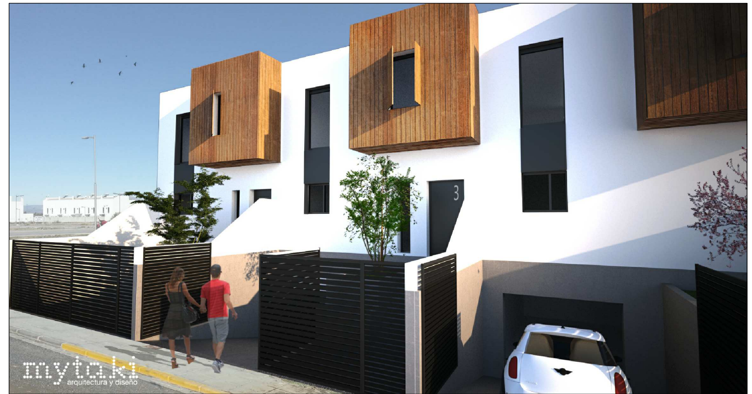
Imágen conceptual de fachada de proyecto.