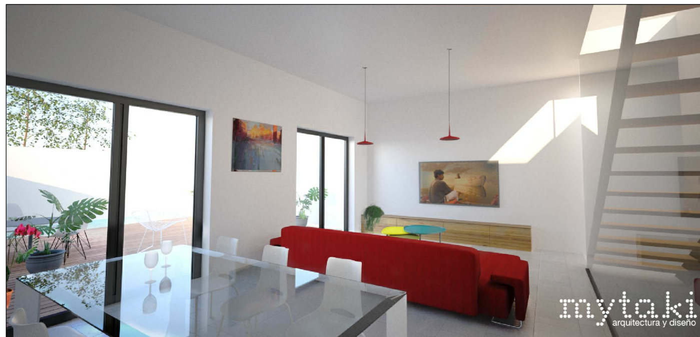
Imágen conceptual de proyecto.