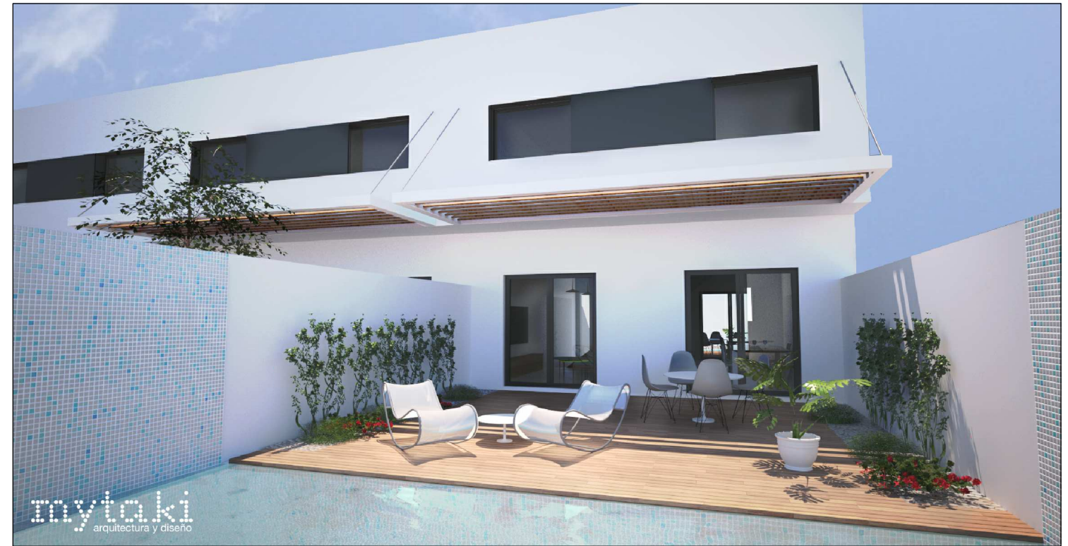
Imágen conceptual de fachada de proyecto.